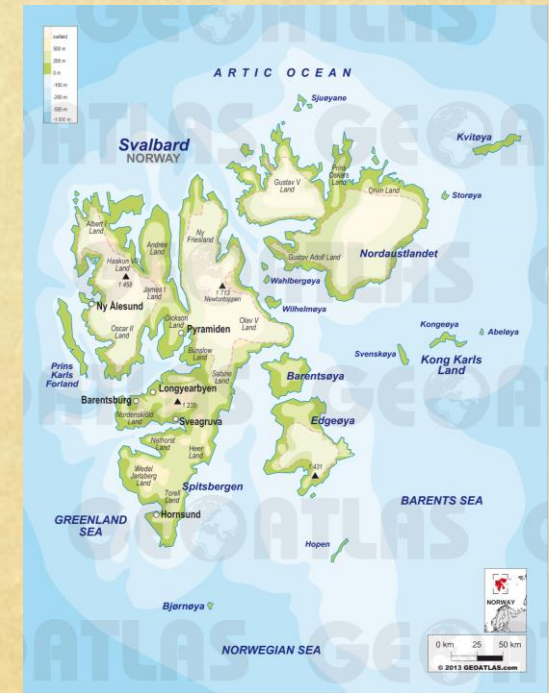
Баренцбург (арх. Шпицберген)